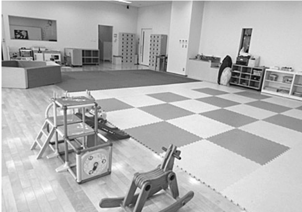
Figure. 1 子育て支援室