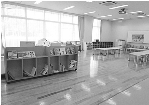
Figure. 2 保育演習室