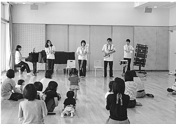
Figure. 3 表現スタジオ